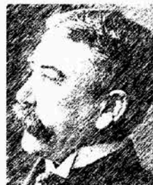
Ferdinand de Saussure